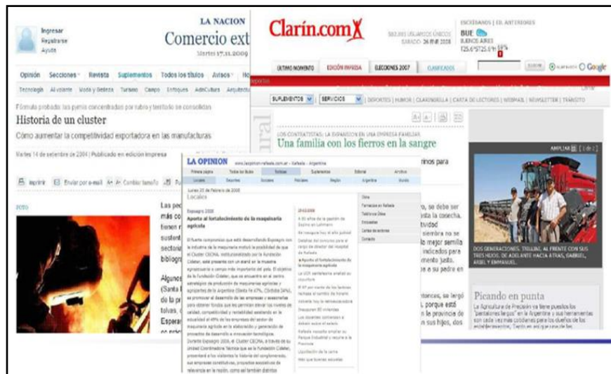
Figura 1. El Cluster en los periódicos provinciales, regionales y nacionales