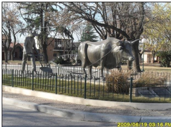
Fotografía 3: Escultura en la ciudad de Armstrong, Departamento Belgrano, Santa Fe.