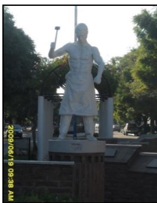
Fotografía 4: Monumento en la ciudad de Las Parejas, Departamento Belgrano, Santa Fe.