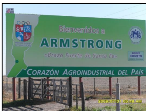
Fotografía 2. Slogan en la entrada a la ciudad de Armstrong, Departamento Belgrano, Santa Fe.