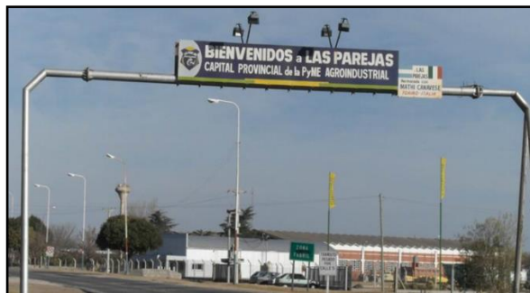
Fotografía 1. Slogan en la entrada a la ciudad de Las Parejas, Departamento Belgrano, Santa Fe.